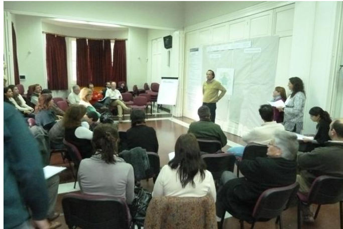
La participación ciudadana y la capacidad de involucramiento de los juninenses Han sido una de las claves del éxito de este trabajo.

E l área social fue abordada en dos talleres, la premisa para ambos es la inclusión social, se abordaron los desafíos de abordaje integral de los grupos vulnerables (infancia y niñez, jóvenes, adultos mayores y población con capacidades diferentes) y calidad educativa, incluyendo cuestiones de seguridad ciudadana, en una de las jornadas; en la otra se abordaron los desafíos de promoción de la salud, hábitat y vivienda y pueblos.