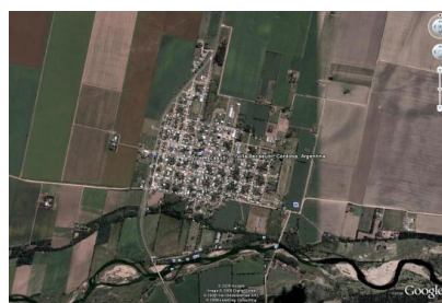
Planeamiento aéreo urbano de Villa Ascasubi