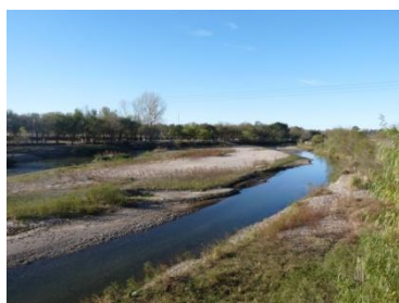
Rio Calamochita en Villa Ascasubi

El desarrollo turístico con criterios de sustentabilidad se considera una Política de Estado que debe articular las diferentes competencias no solo a nivel horizontal sino también descentralizado y como tal articulando entre organismos nacionales, y entre ellos y los organismos locales.